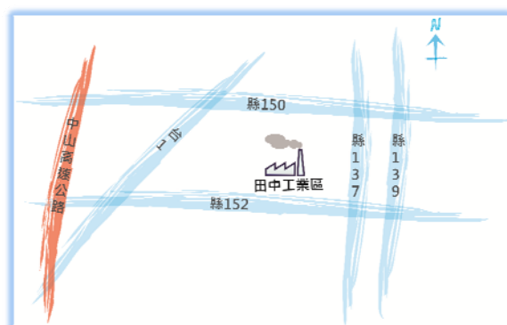
工業區地理位置圖