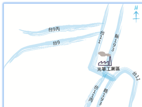
工業區地理位置圖