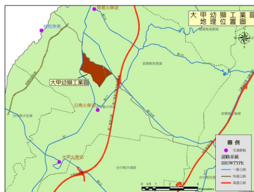
工業區地理位置圖