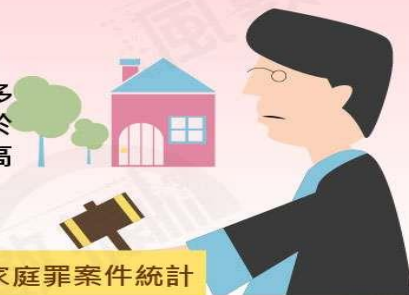
2016年地檢署偵辦妨害婚姻及家庭罪案件統計

2016年妨害婚姻及家庭罪的判決結果顯示，被告人數男多於女，但定罪人數卻是女多於男，女性獲判有罪比率明顯高於男性